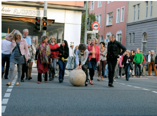
Stadttrundgang mit der sozialen HolzKugel von Paul Feichter / Foto: Angela von Brell

Tangency-Stadtberührungen 2012 in Osnabrück