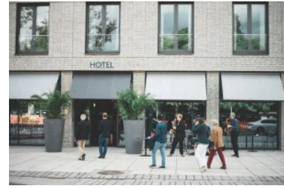
FREIgeist Göttingen, PreOpening 2018

25.04.2019 | 10:30-17:00 Uhr | Göttingen Ort: FREIgeist Göttingen, Berliner Straße 30 37073 Göttingen