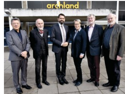
Der niedersächsische Umwelt- und Bauminister Olaf Lies (Mitte) mit dem Vorstand des Netzwerk Baukultur in Niedersachsen e.V.