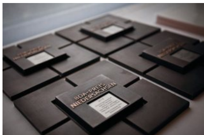
BDA Preis Plaketten