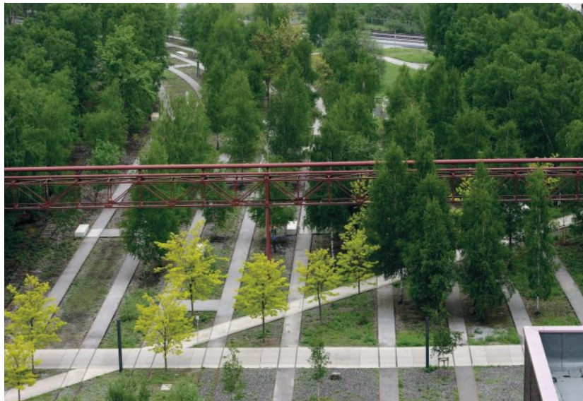
Der Zollverein Park, ein Ensemble aus Industriearchitektur, Landschaft und Kunst, Zeche Zollereim, Essen

Ort: Architektenkammer Nds. Sitzungszimmer 2, Stock Friedrichswall 5 30159 Hannover