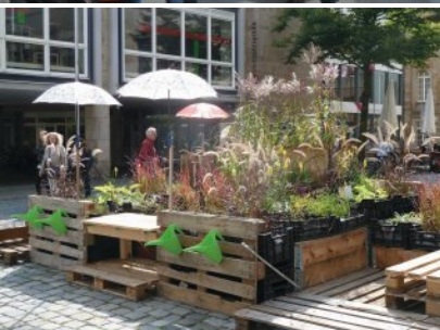
oben: Weserfahrt „Lust auf Grün“ im Rahmen der Architekturzeit 2018 unten: Nachwuchswettbewerb: Pop-Up-Gärten 2015 in Osnabrück