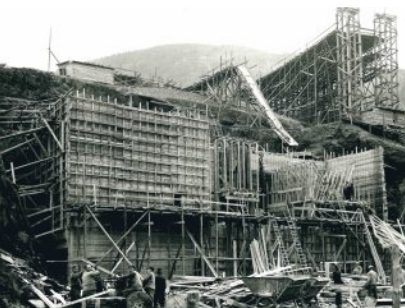
Bau der neuen Aufbereitungsanlage des Erzbergwerkes Rammelsberg, 1935/36

Im Rahmen des Bauhaus-Jubiläums bietet das Weltkulturerbe Rammelsberg neben Sonderführungen auch Rahmenprogramme zu den Sonderausstellungen an. Die Termine finden Sie auf der letzten Seite unter den Veranstaltungstipps oder unter: www.rammelsberg.de Ort der Veranstaltungen: Weltkulturerbe Rammelsberg Bergtal 19, 38640 Goslar