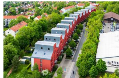
Die „Rote Reihe“ in Göttingen. Bauherrin: Städtische Wohnungsbau Göttingen, Architekt Sergio Pascolo, Venedig. Freiraumplanung SPALINK-SIEVERS Landschaftsarchitekten.