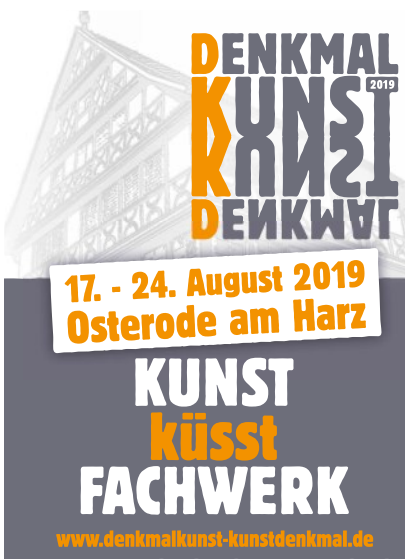
Plakat zum Festival „DenkmalKunst - KunstDenkmal 2019“ in Osterode am Harz Gestaltung: Tanja Armbricht/Agentur Publicity unter Verwendung eines Fotos von Daniel Li