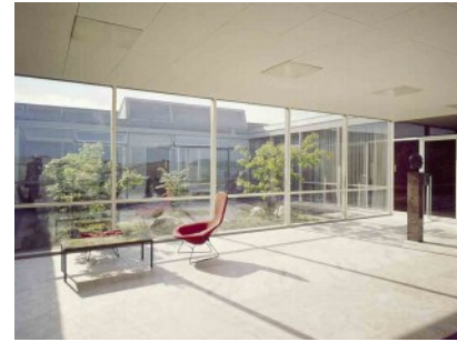
Empfangs- und Verwaltungsgebäude der Firma Naturstein Billen, Wolfsburg. Foto: Heinrich Heidersberger, 1959

08.09.2019 | 11-17 Uhr | Wolfsburg Führungen zu jeder vollen Stunde Ort: Ehem. Empfangs- und Verwaltungsgebäude „Naturstein Billen“, Maybachweg 9, 38446 Wolfsburg www.wolfsburg.de/architektur.de