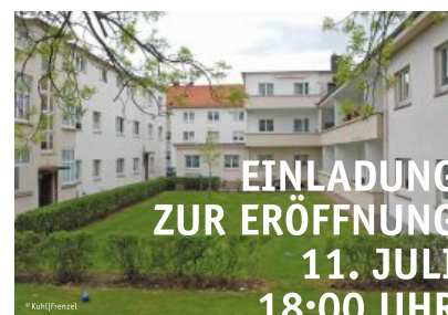
Doppelausstellung zum Bauhausjahr oben: „Auf dem Weg zum Bauhaus. Das Erwachen der Moderne in Niedersachsen“, Foto: Niedersächsisches Landesamt für Denkmalpflege unten: „Neues Bauen in Osnabrück während der Weimarer Zeit“, Foto: Kuhl|Frenzel